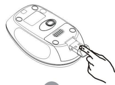
1 Αφαίρεση του δέκτη

2, Αν θέλετε να σταματήσετε τη χρήση του ή να το αποθηκεύσετε, μπορείτε να τοποθετήσετε το δέκτη ξανά στη θήκη του στο κάτω μέρος του ποντικιού (βήμα 2).