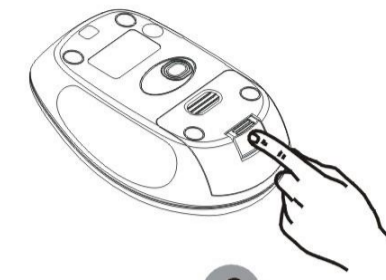
2 Αποθήκευση του δέκτη