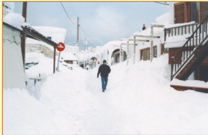
Στην κατάλευκη Σκύρο οι κάτοικοι με δυσκολία βγαίνουν από τα σπίτια τους.

Ευτυχώς μετά τη Δευτέρα ο καιρός γύρισε σε νοτιά και το χιόνι έλιωσε χωρίς να παγώσει.