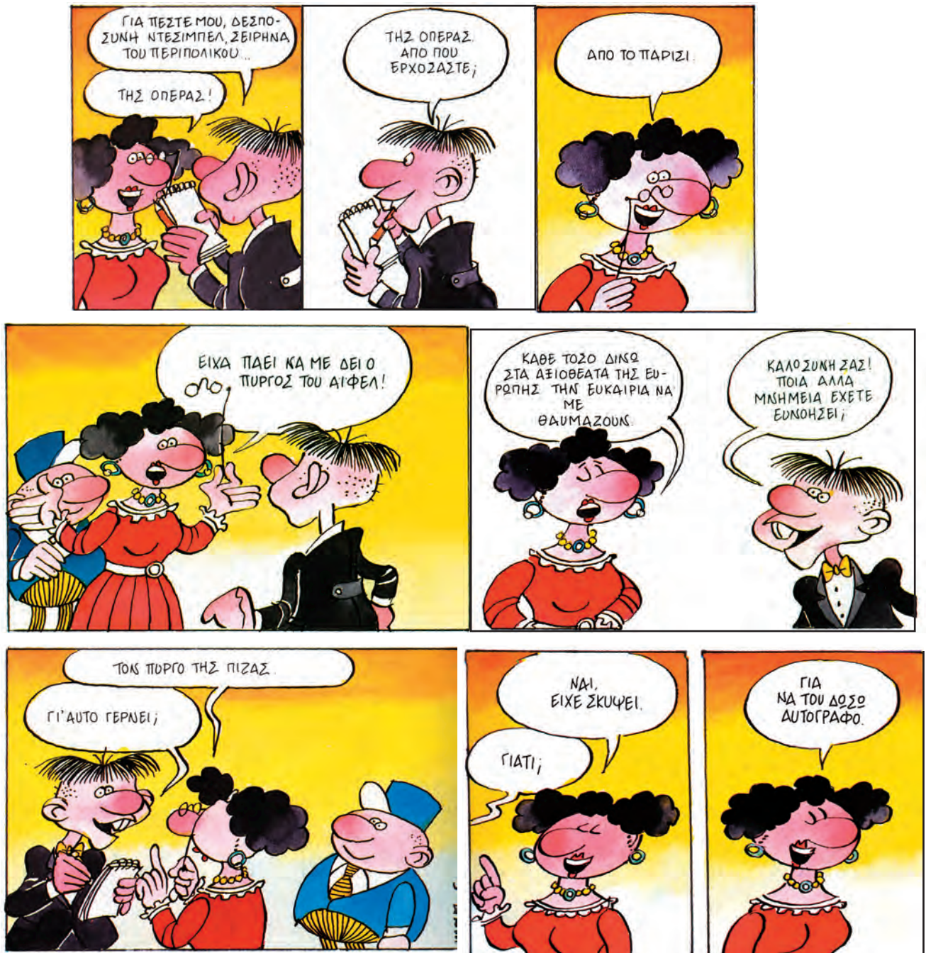
Ευγένιος Τριβιζάς, Φρουτοπία-4, Ο μανάβης και η σοπράνο , εκδ. Πατάκη, Αθήνα, 1994, σκίτσα Ν. Μαρουλάκης

ερίτημη: σεβαστή πριμαντόνα: η πρωταγωνίστρια μουσικού θεάτρου όπερα: μελοποιημένη θεατρική παράσταση δεσποσύνη: δεσποινίδα