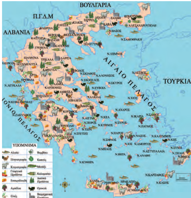
Εικόνα 2.1: Χάρτης παραγωγής προϊόντων

2. Δίνονται τα εξής είδη χαρτών: οδικός, παραγωγής προϊόντων, γεωμορφολογικός, πολιτικός, ακτοπλοϊκός, αρχαιολογικός. Σκέψου και απάντησε ποιον χάρτη θα χρησιμοποιήσεις, για να: