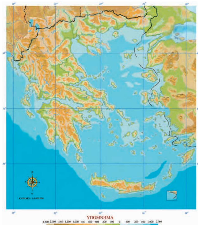
Εικόνα 10.1: Γεωμορφολογικός χάρτης της Ελλάδας

Δίνονται τα ονόματα νησιών: Νάξος, Ζάκυνθος, Κως, Ρόδος, Θάσος, Λευκάδα, Λήμνος, Σαμοθράκη, Κέρκυρα, Χίος, Λέσβος, Άνδρος, Κεφαλονιά, Κύθηρα. Τοποθέτησέ τα στον παρακάτω χάρτη.