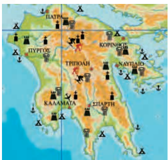
Εικόνα 3.1: Χάρτης με σύμβολα

3. Παρατήρησε τον χάρτη της Πελοποννήσου, ο οποίος δε συνοδεύεται από υπόμνημα. Προσπάθησε να σχεδιάσεις μια εκδρομή. Ποια προβλήματα θα παρουσιαστούν, καθώς θα καταστρώνεις τα σχέδιά σου;