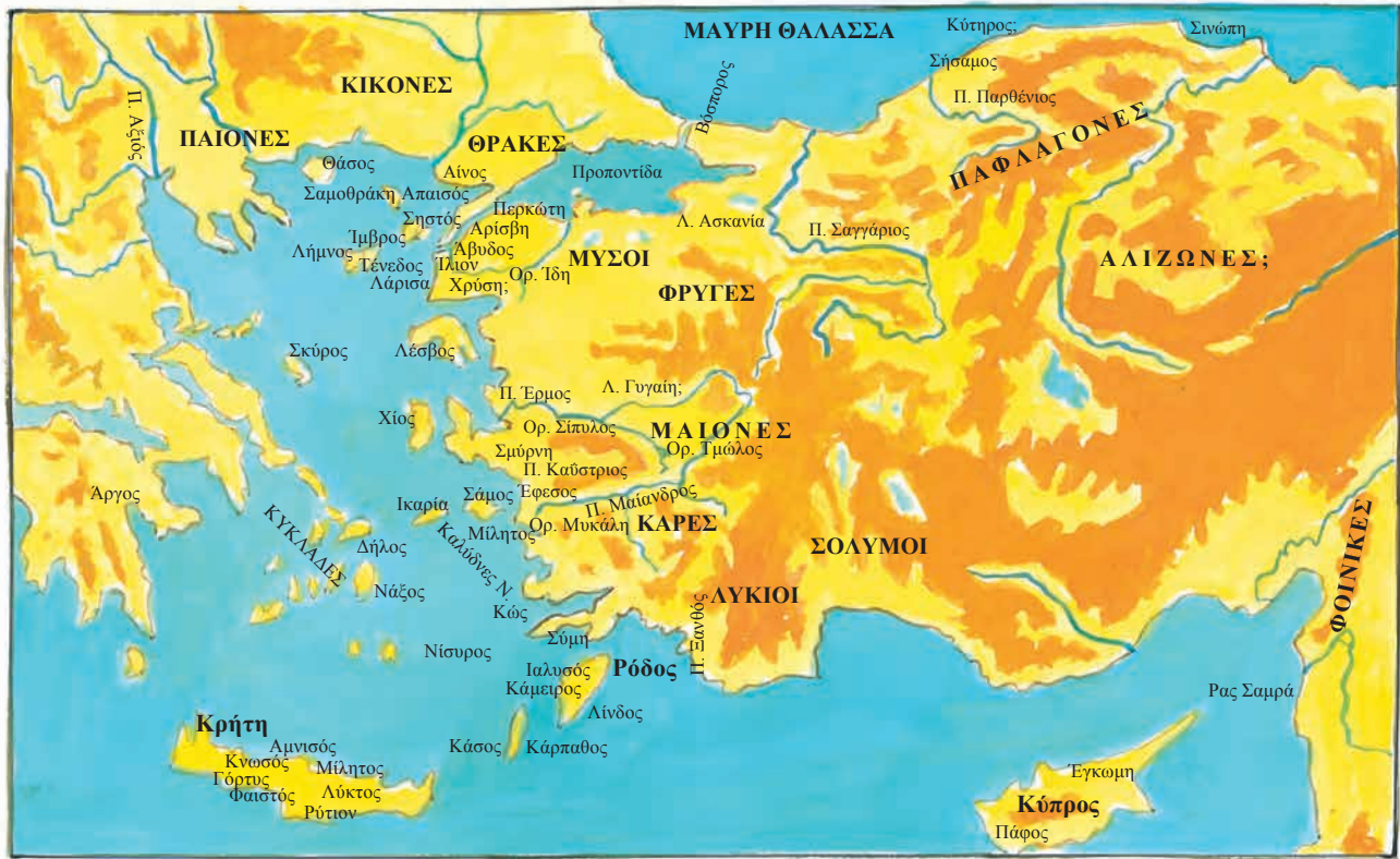
Χάρτης 2. Το Αγαίο και η Μ. Ασία.