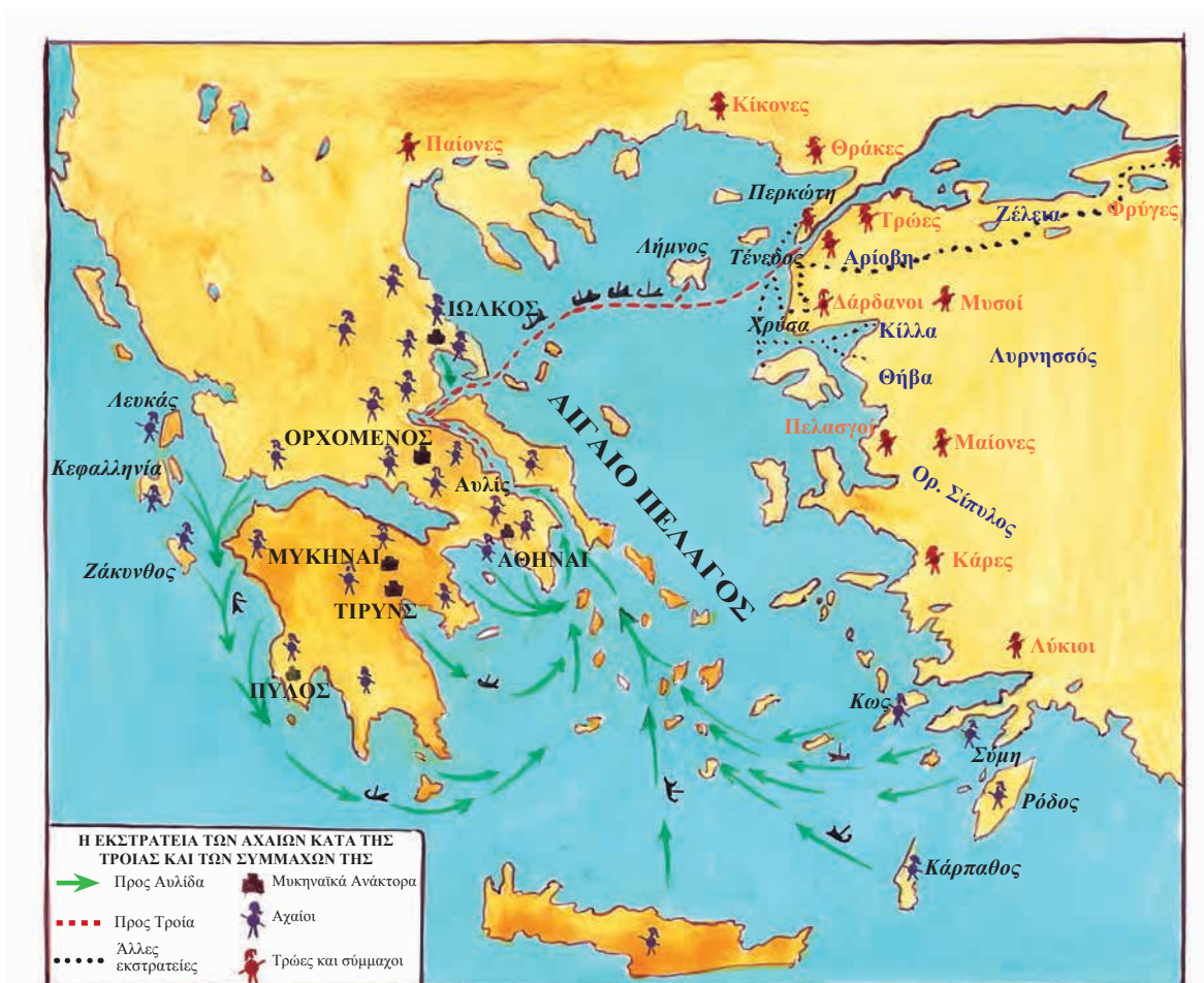
Χάρτης 1. Το Αιγαίο των μυκηναϊκών χρόνων και η τρωική εκστρατεία.

Οι θεοί που γνωρίσαμε στην Οδύσσεια δεν είναι το ίδιο εγωιστές και άδικοι, όπως στην Ιλιάδα : στο νεότερο έπος έχει αρχίσει να καθιερώνεται στον Όλυμπο κάποια ηθική τάξη. Είναι βέβαια και οι θεοί της Οδύσσειας γεμάτοι πάθη, μα δεν έχουν την πρωτογονική εκρηκτικότητα που θα συναντήσουμε στους θεούς της Ιλιάδας . Ανάλογες αντιθέσεις θα παρατηρήσουμε και στους δύο κεντρικούς ήρωες των επών. Ο Οδυσσέας δεν έχει την ορμητικότητα του Αχιλλέα ούτε την έλλειψη του μέτρου, μα άλλες, πιο πολύτιμες στην καθημερινή ζωή, αρετές, όπως η εξυπνάδα, η επιμονή και η καρτερικότητα. Για να πετύχει τον σκοπό του στηρίζεται περισσότερο στην εφευρετικότητα του νου του, παρά στη μυϊκή του δύναμη. Με λίγα λόγια ο χαρακτήρας της Ιλιάδας είναι πολεμικός, και γι' αυτό μερικές φορές σκληρός, ενώ της Οδύσσειας είναι πιο ήρεμος και ειρηνικός. Αν ο δεύτερος ταιριάζει σε έναν ώριμο ποιητή, οπλισμένο με την πείρα της ζωής, τότε ο πρώτος αποκαλύπτει σίγουρα έναν δημιουργό στην ακμή της νεανικής ηλικίας του.