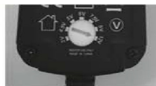
Φωτογραφία 2 (2)