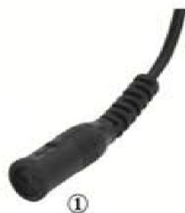
Φωτογραφία 2 (1)